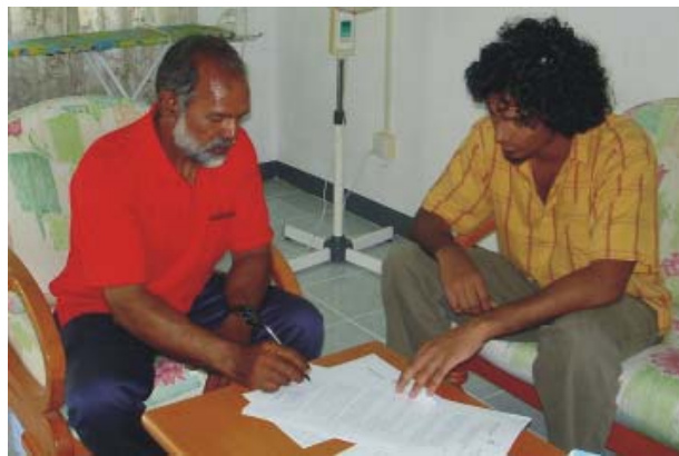
شکل 1: بررسی وضعیت سرفه مزمن در بیمارستانها و مراکز درمانی تهران

در این مطالعه برسیه وضعیت سرفه مزمن در میان افرادی که در مراکز درمانی تهران به سرفه مزمن مبتلا شده بودند، انجام شد. در این مطالعه 207 بیمار مبتل به سرفه مزمن و 207 بیمار سالم را در برگیرنده بود. در این مطالعه 8 مطالعه دیگر که در سال 2005 و 2007 در بیمارستانها و مراکز درمانی تهران انجام شد، در برگیرنده بود.