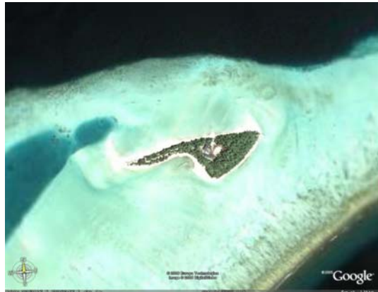
פ. תמונת לוויין מאת גוגל, 1990. ניתן לראות את ארץ ישראל ואת הים התיכון.

בשנת 2005 נוסדה הרשות הארץ ישראלית לפיתוח ארץ ישראל. מטרתה היא להפוך את ארץ ישראל למדינה מודרנית, חזקה ובעלת אופק עתידי. הרשות פועלת במסגרת הממשלה ויש לה סמכויות רבות. מטרתה העיקרית היא להפוך את ארץ ישראל למדינה מודרנית, חזקה ובעלת אופק עתידי. הרשות פועלת במסגרת הממשלה ויש לה סמכויות רבות. מטרתה העיקרית היא להפוך את ארץ ישראל למדינה מודרנית, חזקה ובעלת אופק עתידי.